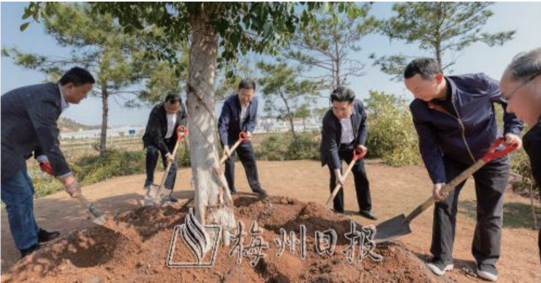
馬正勇、王暉、戚優華、王慶利等市領導在梅州高新技術產業園同心湖公園參加義務植樹。