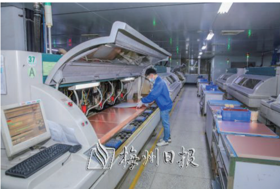
梅州市志浩電子科技有限公司生產車間一景。

三月，萬物蓬勃生長，工業園區裏更是一片熱火朝天的生產場景。在梅州市志浩電子科技公司的工廠裏，運輸車來回穿梭，流水線上的機器高速運轉，工人忙碌而有序。